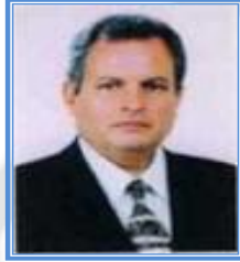
رئيس الجامعة أ.د/ محمود الطيب ناصر